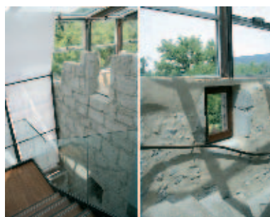
7 - Hall d'entrée sous la verrière