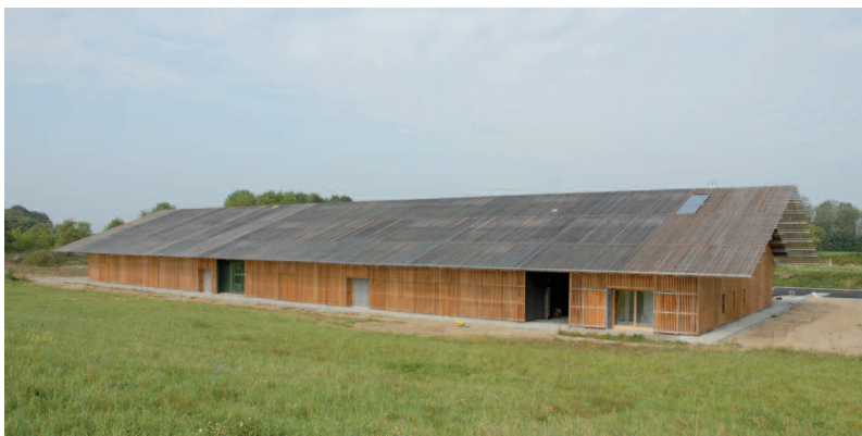
1 / 3 / 5 Harmonie et raffinement des surfaces