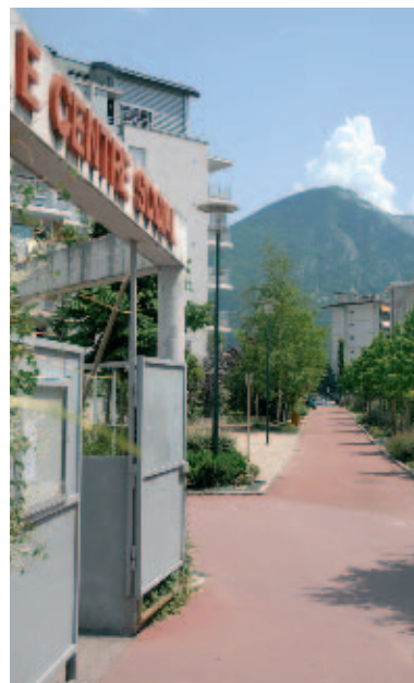
2 / 4 Création de nouvelles perspectives vers le paysage du Mont Veyrier et les équipements publics