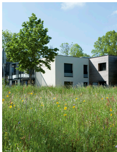
5 - Terrasse et jardin privatif